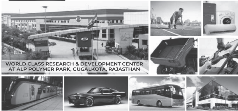
WORLD CLASS RESEARCH & DEVELOPMENT CENTER AT ALP POLYMER PARK, GUGALKOTA, RAJASTHAN