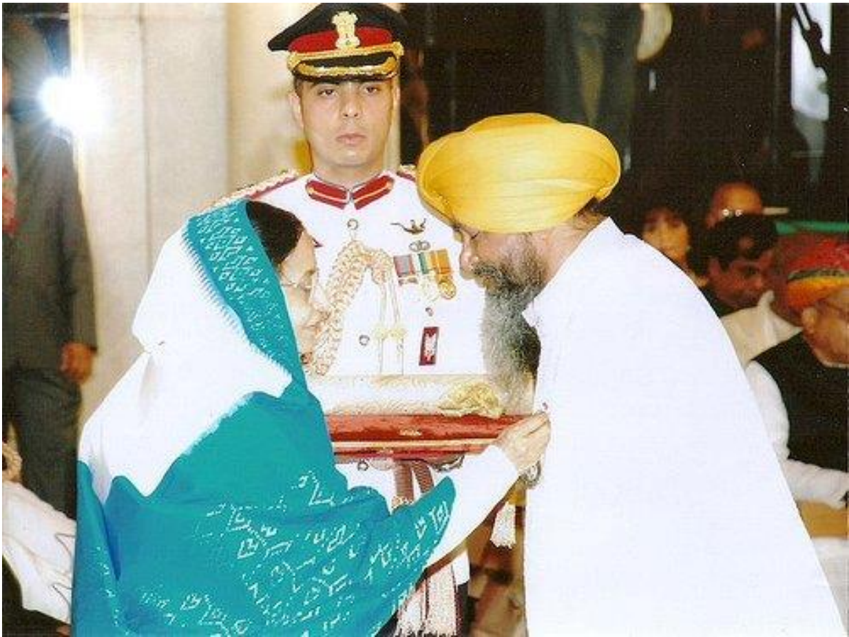
(Bhai Nirmal Singh Khalsa receiving Padma Shri from the President Smt Pratibha Devi)