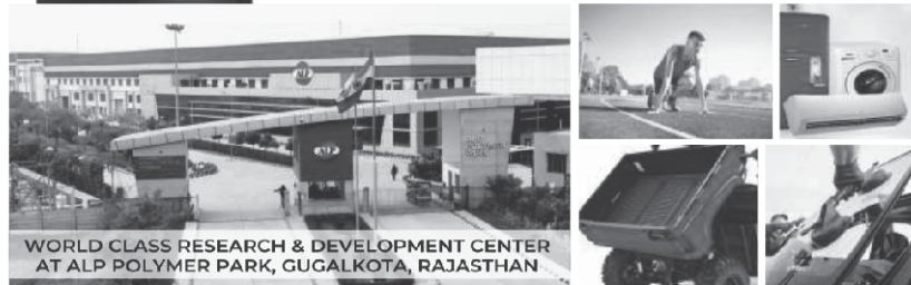
WORLD CLASS RESEARCH & DEVELOPMENT CENTER AT ALP POLYMER PARK, GUGALKOTA, RAJASTHAN