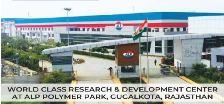
WORLD CLASS RESEARCH & DEVELOPMENT CENTER AT ALP POLYMER PARK, GUGALKOTA, RAJASTHAN