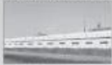
ALP OVERSEAS PVT. LTD. (WUDRAPUR, UK)

EPDM/ PVC/ TPE/ TPR/ EXTRUDED WEATHER STRIPS - PLASTIC MOULDED PARTS - NITRILE/ EPDM FOAM INSULATION