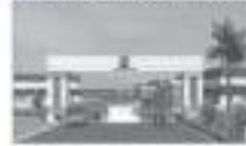
ALP POLYMER PARK PVT. LTD. (GUGALKOTA, MERRWARA RAJASTHAN)