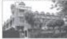
ALP AEROPLEX INDIA P. LTD. (NOIDA, UP)