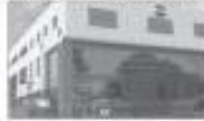
ALP PLASTICS PVT. LTD. (GURGAON, HARYANA)