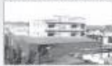
ALP NISHIKAWA CO. PVT. LTD. (LALRU (PUNJAB)