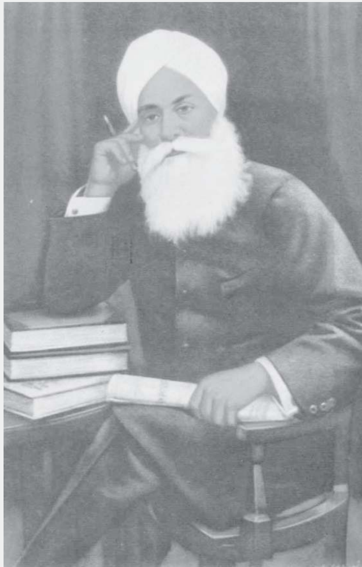
BHAI KAHAN SINGH NABHA