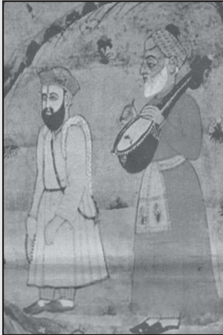
ਗੁਰੂ ਨਾਨਕ ਦੇਵ ਜੀ ਅਤੇ ਡਾਈ ਮਰਦਾਨਾ (ਇਕ ਪੁਰਾਤਨ ਚਿੱਤਰ - ਖਾਲਸਾ ਸਮਾਚਾਰ ਵਿਚੋਂ ਧੰਨਵਾਦ ਸਹਿਤ)