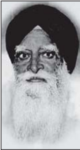
Bhai Samund Singh ji